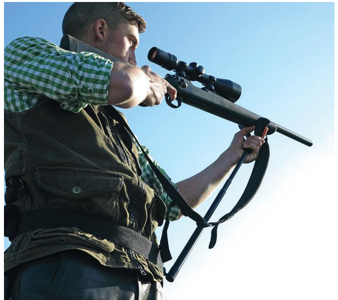
Onder andere te koop bij schietsimulator.nl en hesvanzweeden.nl €119,00