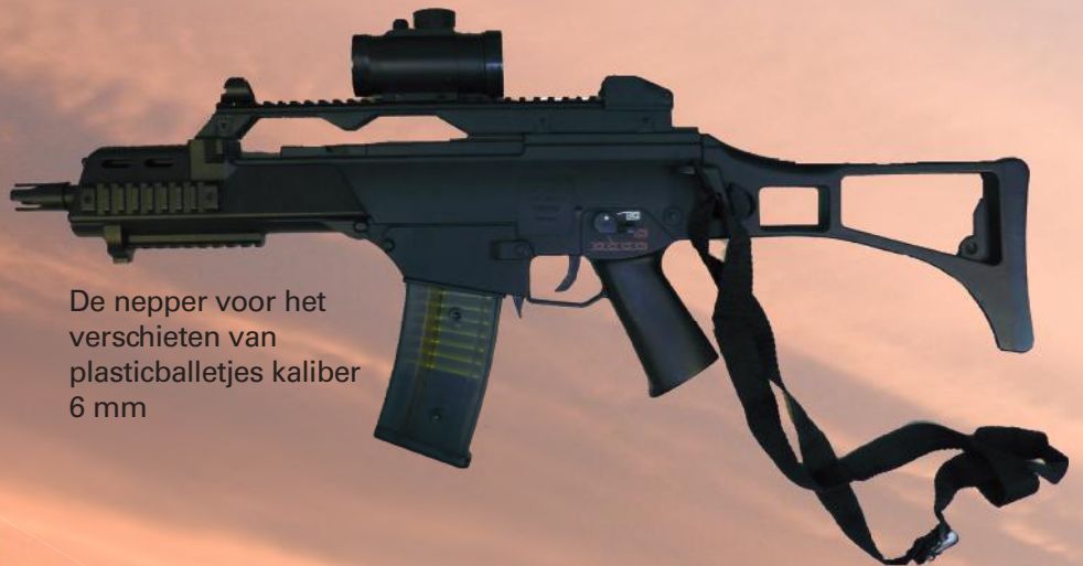
De nepper voor het verschieten van plasticballetjes kaliber 6 mm