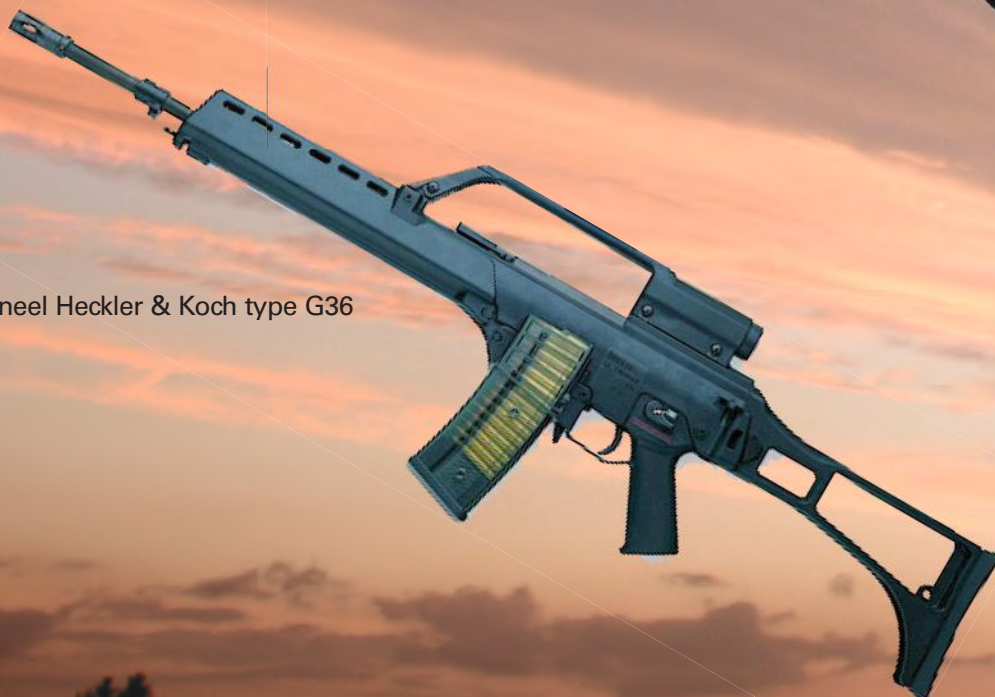
Het origineel Heckler & Koch type G36