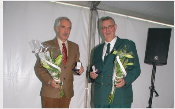
ERE-LIDMAATSCHAP VOOR EINDREDACTEUR EN PR- MAN