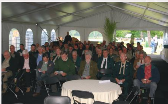
AANWEZIGE LEDEN EN DONATEURS