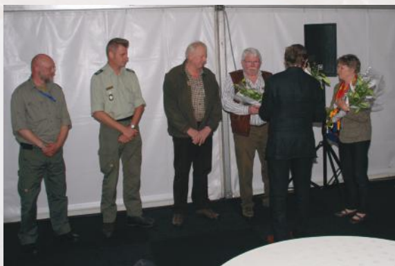
AFSCHEID VAN DE JUBILEUMCOMMISSIE