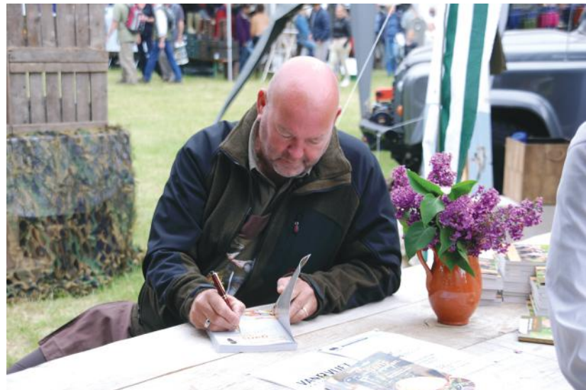
↑ SIGNEREN & CONSUMEREN ↓