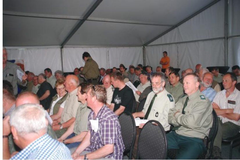
DE ZAAL WAS GOED GEVULD TIJDENS DE AV.

Een dergelijk evenement op een locatie midden in het bos is gevoelig voor 'inbraak', er staan tenslotte behoorlijk wat kostbaarheden uitgesteld. Mooi is het dan dat door de vrijwillige inzet van lokale groene BOA's het terrein ook 's nachts is beveiligd. Volgens de organisatie is er niets gekk gebeurd, op een enkel omgedraaid bordje na.