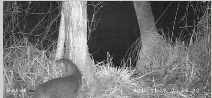
OTTER BETRAPT OP WILDCAMERA

De Nieuwkoopse vissers, verenigt in een coöperatie, hebben de kosten van aanpassing voor hun rekening genomen. De fuiken werden in een ijtempo aangepast en zo is het probleem van verdrinkingsgevaar voor Otters in deze fuiken opgelost. Er zijn tot op heden ook geen Otters in fuiken verdronken.