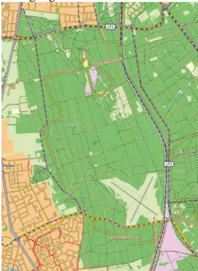
Heumensoord (Open fiets map)

wachter is het buitenleven hem met de paplepel ingegoten. Daarom was het voor hem een logische stap om beroeps militair te worden. Als wachtmeester bij de Koninklijke Marechaussee bleef de boswachterdroom aan hem knagen. In 2009 begon hij in zijn vrije tijd als vrijwillig BOA bij Natuurmonumenten Deltakust. Daarna is hij 2 jaar werkzaam geweest bij Het Zeeuwse Landschap, om uiteindelijk in november 2013 als beheerteam medewerker bij Natuurmonumenten op de Zuidwest Veluwe aan de slag te gaan.