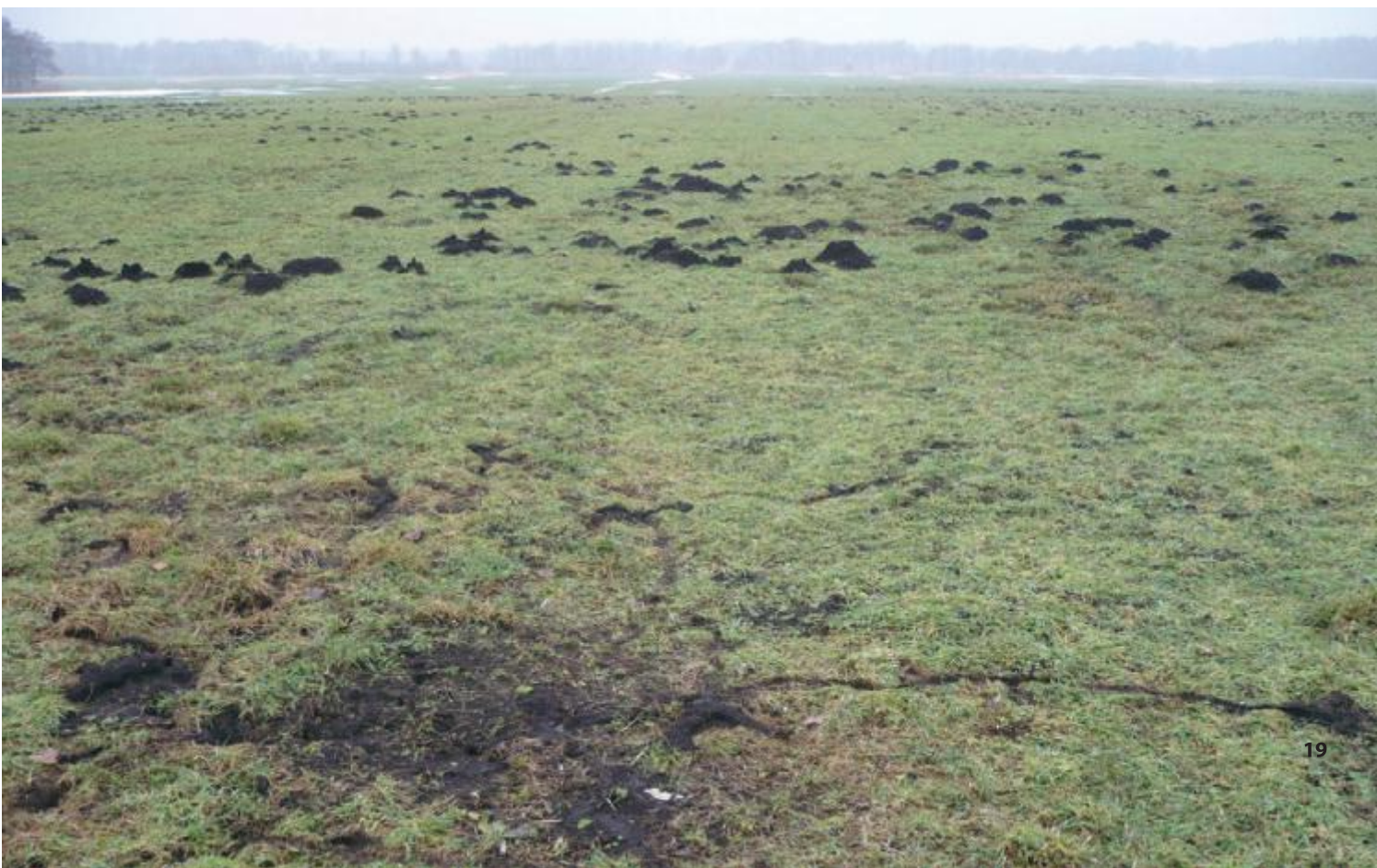
Foto 1. Een levende grasmat in het beekdal van de Vledder Aa, op 21 januari 2010, volstrekt normaal een halve eeuw geleden, tegenwoordig zeldzaam. Een dichtheid van duizend veldmuizen per hectare is onder deze omstandigheden zeker haalbaar.

Een ding is zeker: in deze vervlakkende wereld kun je beter geen voedselspecialist zijn.