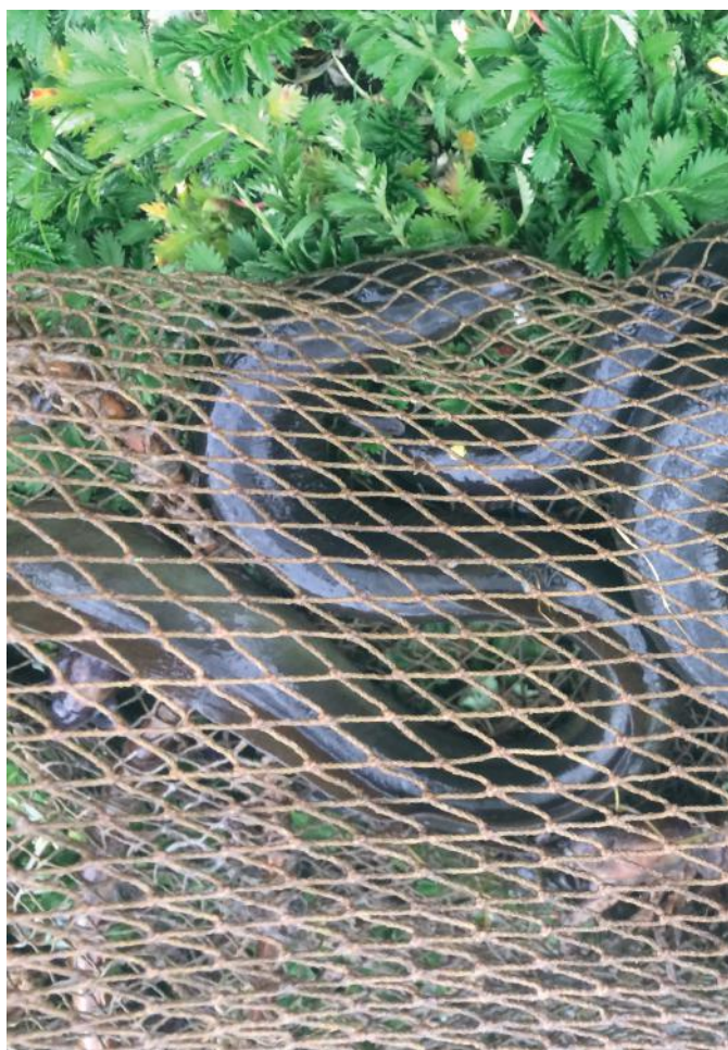
Aal in fuik