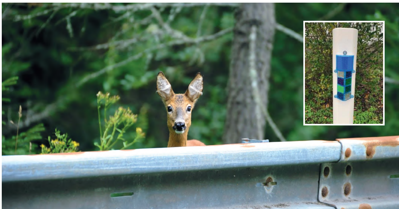
Wildspiegels geplaatst langs de wegen waar regelmatig wild in aanraking komt met het verkeer.