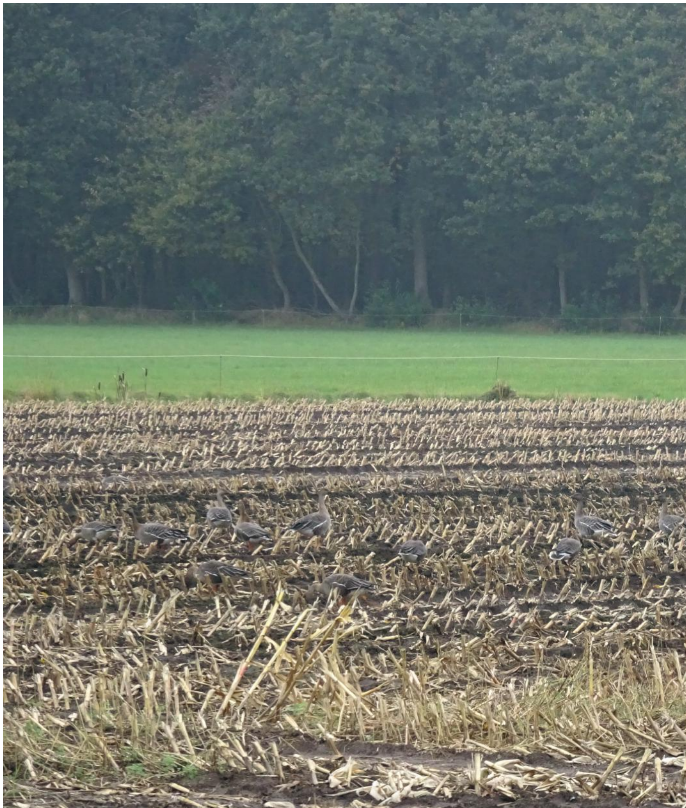
Maïsland is na de oogst een trekpleister van jewelste voor overwinterende ganzen, zoals deze troep toendrariet ganzen (en een kolgans) bij Wapse laat zien, 27 oktober 2016.

Dat ganzen voor eeuwig zullen swingen, lijkt me uitgesloten. Immers, de kans dat het huidige landbouwsysteem niet nóg verder industrialiseert en vervlakt, is miniem. Maar ik geef toe: ook mijn voorspellende vermogen overstijgt vast niet dat van economen. Een reden te meer om ons te verheugen op het staaltje landjepik dat de ganzen hebben laten zien.