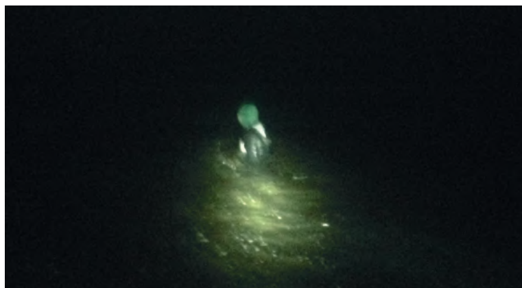
Warmtebeeldcamera laat verdachte zien

Op 21 juni werd er post gevat met zicht op de geplaatste fuiken. Omstreeks 03.00 uur werd er een persoon bij de fuiken aangetroffen; in het water. Deze persoon werd door de opsporingsambtenaren herkend want was reeds driemaal eerder geverbaliseerd voor visstrokerij. Met een warmtebeeldcamera zag Tom de stroper tot zijn nek in het water staan.