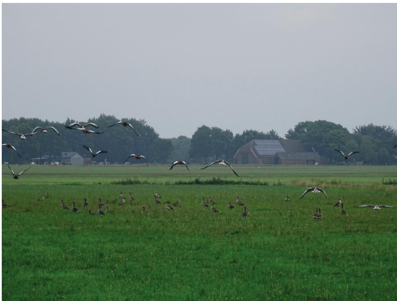
De voedselrijke graslanden trekken grote aantallen ganzen, hier een gemengde groep grauwe ganzen en nijlganzen in het dal van de Beilerstroom bij Dwingeloo, 13 juli 2018.