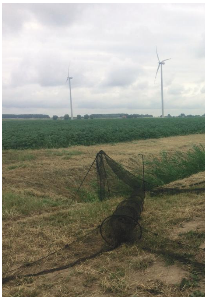
Inbeslag genomen fuiken