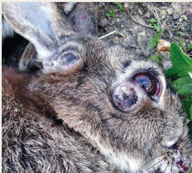
Voorbeeld van hazenpest

Tijdens de uitbraak van hazenpest in 2015 in Friesland werd aangegeven dat de hazen opvallend zwak en apathisch waren, een schommelende gang hadden en hun natuurlijke schuwheid waren verloren. Maar omdat deze symptomen ook bij andere hazenziekten voorkomen, is aan de hand van het gedrag of uiterlijk van een haas niet te zeggen welke ziekte het dier onder de leden heeft.